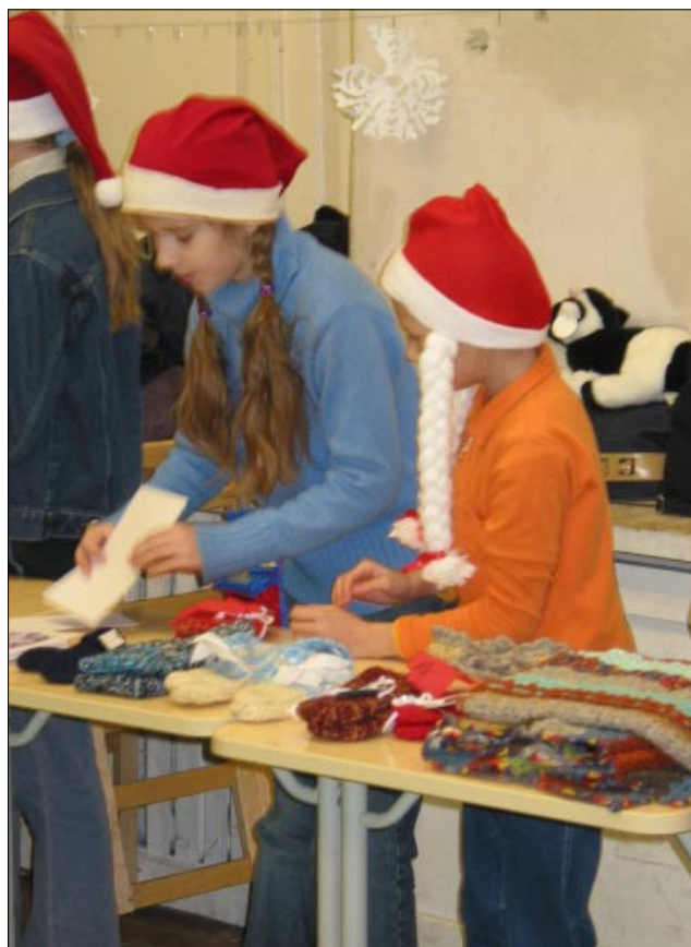
Pilt on tehtud eelmise aasta jõululaadal, aga samasugused vilkad päkapikud olid ametis ka sel aastal