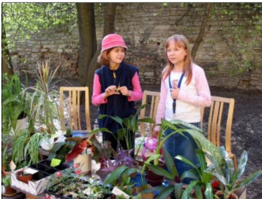
Pöial-Liisid lilli ja taimi müümas

SUUR- SUUR AITÄH kunstnikele, kõigile ostjatele, toetajatele ja korraldajatele!