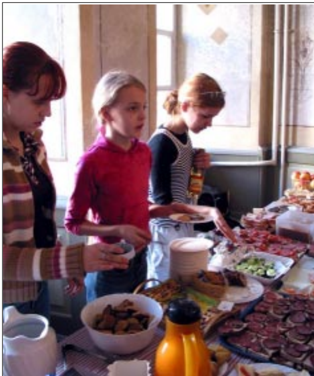
Kohviku lookas laudadelt leidis iga laadaline näljakustutust